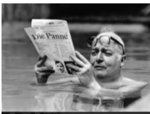
Friedrich Dürrenmatt in seinem Schwimm-Pool, 1979